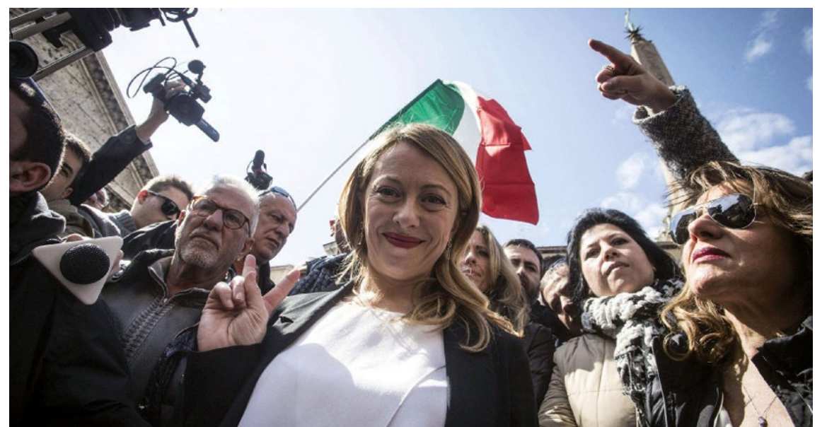
Giorgia Meloni in piazza del Pantheon, dove ha annunciato la sua candidatura a sindaco

che dà forza a Bertolaso, che respinge le offerte di «collaborazione» di Giorgia Meloni: «Vado avanti come una ruspa - assicura -. A lei scriverò stasera: cara Giorgia, continuo a volerti bene nonostante tutto. E poi le manderò 7 rose rosse». Meno conciliante potrebbe essere il leader forzista, al quale non va giù il voltafaccia dei partner di coalizione. C'è chi dice che gli spazi sulle reti Mediaset, per loro, potrebbero restringersi. Pare adombrarlo lo stesso Salvini: «Mi dispiace d'aver un po' litigato, in questi giorni, con Silvio Berlusconi. Dovevo andare a Canale 5, domattina, ma adesso mi hanno detto di non andare».