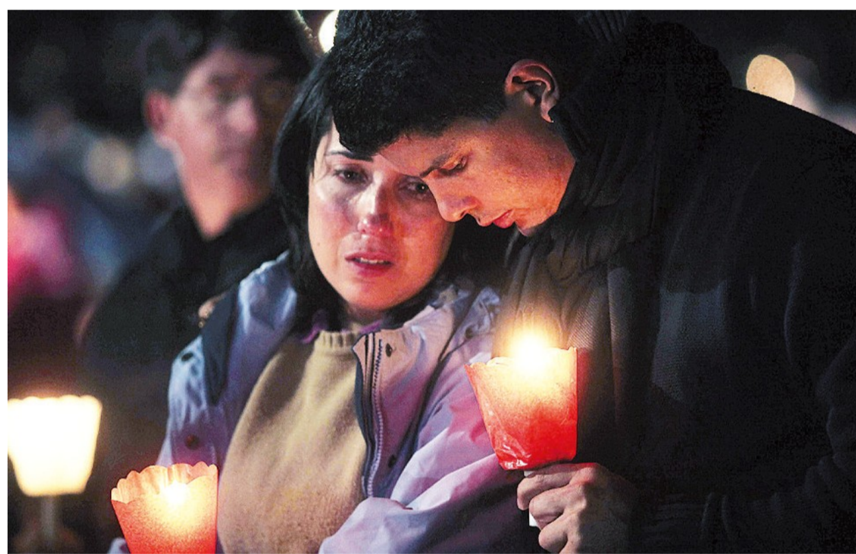
Giovani in preghiera. Sotto, il timbro che verrà apposto sulle «credenziali» dei pellegrini