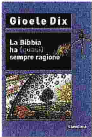
GIOELE DIX La Bibbia ha (quasi) sempre ragione CLAUDIANA Pagine 200, € 19