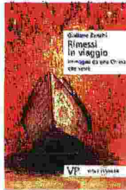
GIULIANO ZANCHI Rimessi in viaggio. Immagini da una Chiesa che verrà VITA E PENSIERO Pagine 240, € 16