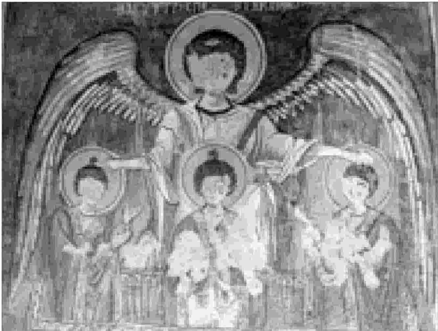
I giovani Anania, Azaria e Misael con l'angelo nella fornace (Chiesa rupestre di Göreme in Cappadocia)