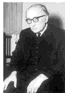
Romano Guardini nacque a Verona nel 1885 e morì nel 1968 a Monaco di Baviera, dove aveva insegnato dal 1948 ed era stato fra i fondatori della Katholische Akademie

(Lettere dal lago di Como. La tecnica e l'uomo , Morcelliana 1993). Ciò pone all'Europa, ormai da tempo, compiti nuovi e li impone una nuova e diversa apertura d'orizzonte. La questione posta da Guardini appare ancor più attuale a quasi un secolo di distanza da quegli anni e dopo tutta la complessa vicenda novecentesca e i primi anni del nuovo millennio. All'Europa è sempre più necessaria una diversa visione della storia e della sua unità, una visione in grado di mettere insieme il tutto e la parte, ripensando in modo differente la loro rela-