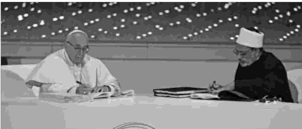
Papa Francesco e il Grande Imam di Al Azhar firmano ad Abu Dhabi la Dichiarazione sulla Fratellanza umana (4 febbraio 2019)