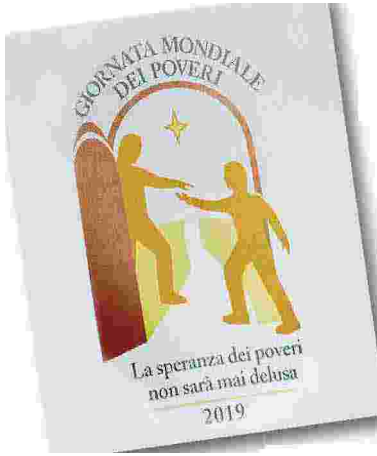
19 novembre 2017 Il Papa pranza con i poveri. Sotto: il sussidio della Giornata