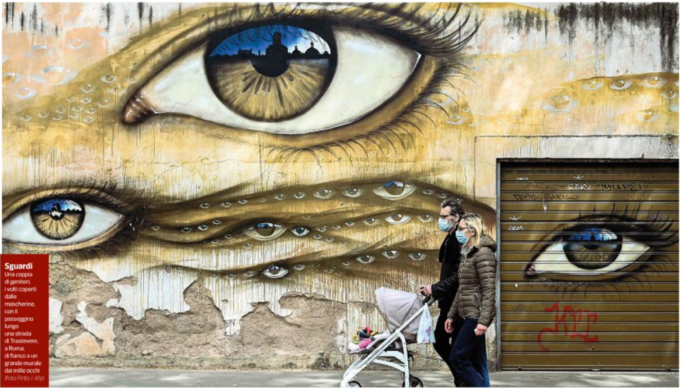
Sguardi Una coppia di genitori, i volti coperti dalle mascherine, con il passeggino lungo una strada di Trastevere, a Roma, di fianco a un grande murale dai mille occhi