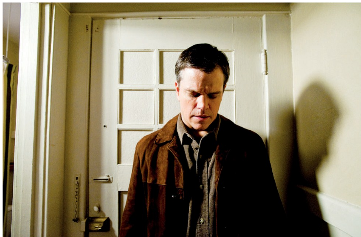
Matt Damon in "Hereafter", il film del 2010 dove Clint Eastwood si interroga sull'aldilà