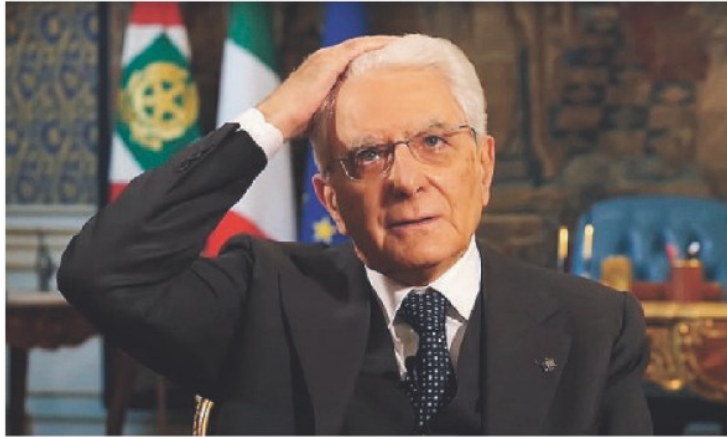
FOTO SIMBOLO Il presidente Sergio Mattarella s'aggiusta i capelli, lunghi per la quarantena. Il Papa prega, durante un temporale in una piazza San Pietro deserta. Sotto, una sessione di laurea all'Università di Wuhan