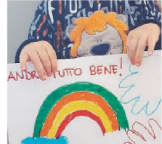
BAMBINI Un arcobaleno per dire #andràtuttobene