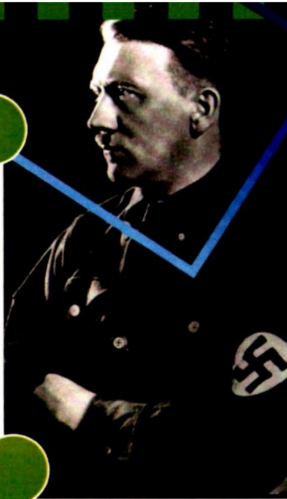
Da sinistra: un ritratto del filosofo Friedrich Wilhelm Nietzsche; Hitler