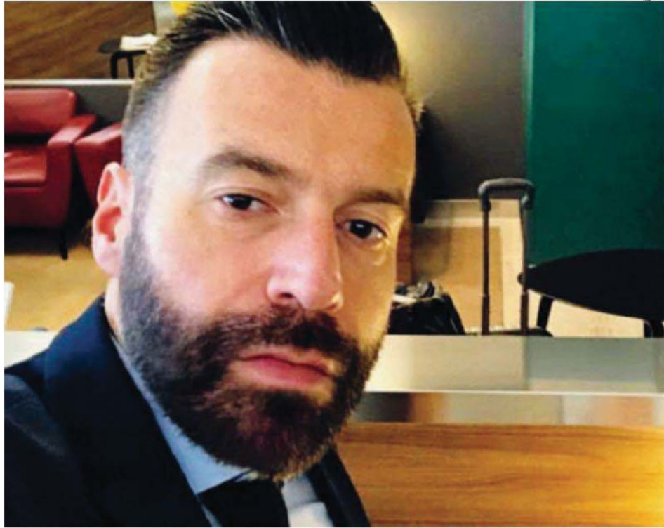
ESTREMISTA Alessandro Zan, 46 anni, attivista Lgbt e deputato del Partito democratico