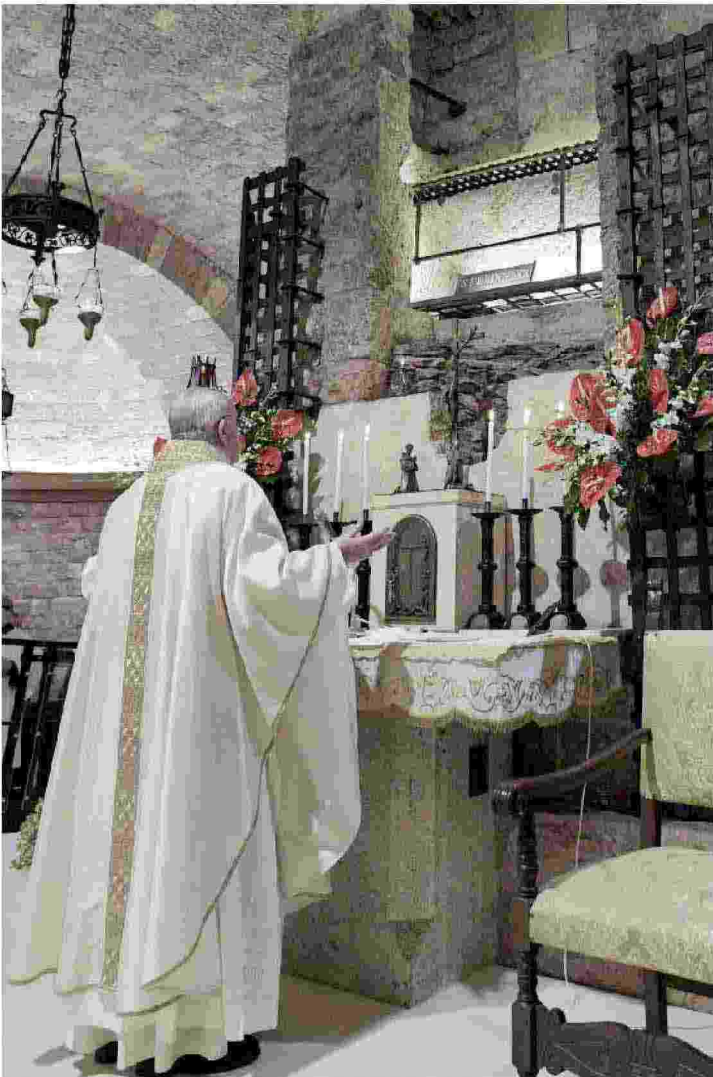
Papa Francesco sabato scorso ad Assisi

Gronchi: fraternità radicata nella dignità di ogni persona Olivero: perdono, cammino di cuore e intelligenza Mokrani: dialogo, aiuto alla convivenza umana