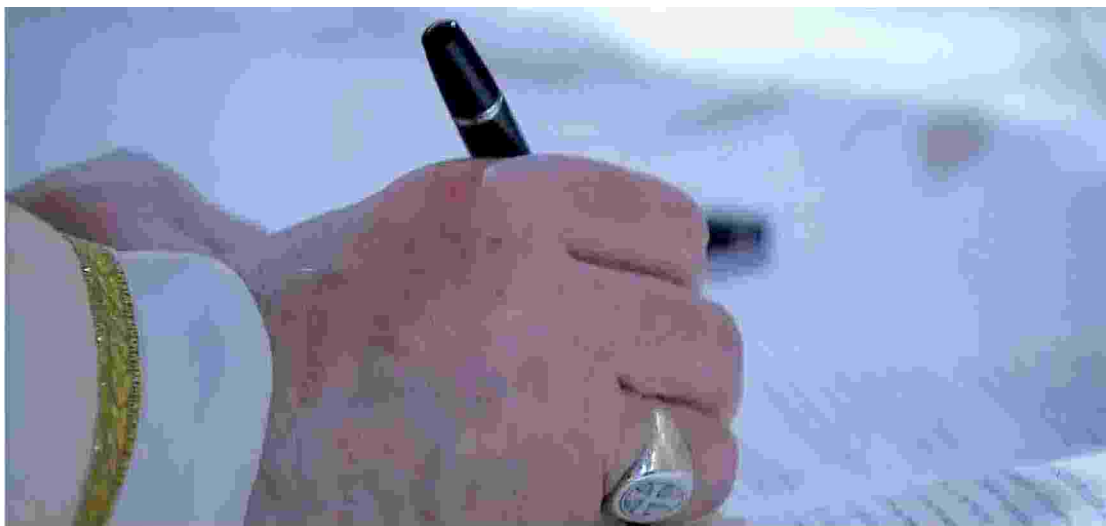
Il Papa firma l’enciclica “Fratelli tutti”

Per rendere possibile lo sviluppo di una comunità mondiale, capace di realizzare la fraternità, è necessaria la migliore politica, posta al servizio del vero bene comune