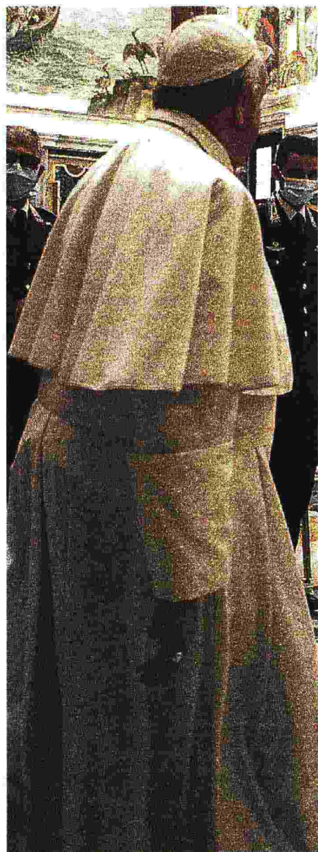
La visita Bergoglio riceve dei carabinieri in Vaticano (Ansa)