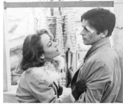
Una scena di "Rocco e i suoi fratelli" (1960)