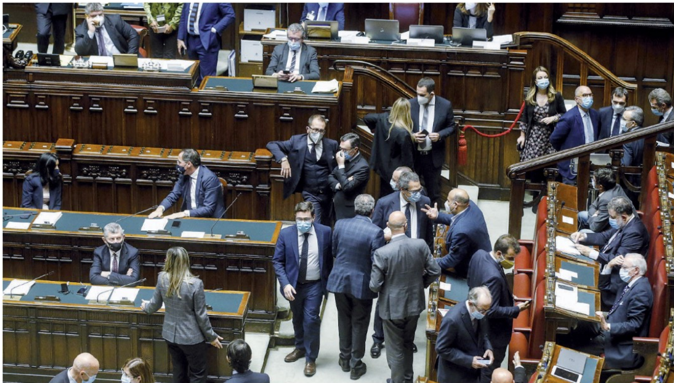
L'Aula della Camera dei Deputati durante una seduta

espressioni tanto controverse. «Il testo unico – prosegue la nota – modifica gli art. 604-bis e 604-ter del codice penale, ed estende le fattispecie di reato e l'aggravante ivi previste, aggiungendo alle discriminazioni per motivi razziali, etnici, nazionali o religiosi anche gli atti discriminatori fondati "sul sesso, sul genere, sull'orientamento sessuale o sull'identità di genere"». Infine una sottolineatura amara: «Mentre l'Italia è ripiombata nella pandemia, le sue piazze vanno a fuoco, e l'economia è al collasso», il Parlamento «concentra le energie per inserire nell'ordinamento penale l'attenzione ai "percorsi di transizione" (sessuali o di genere)».