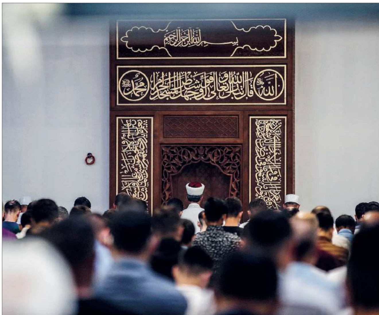
"Dobbiamo contrastare il separatismo islamista", che "spesso si traduce nella costituzione di una contro-società", ha detto Emmanuel Macron lo scorso 2 ottobre

"In questa Europa sotto attacco non esiste una ricetta semplice o univoca", conclude Roy, che indica una strada alternativa alla soluzione macroniana: "Invece di usare soluzioni imposte dall'alto al basso servirebbero quelle che vadano in direzione opposta, dal basso verso l'alto, imparando dalle esperienze locali e favorendo le pratiche religiose pacifiche". Mettere pressione per imporre pratiche religiose specifiche rischia di portare a risultati opposti a quelli sperati, dice il filosofo francese: "Imporre un islam secolarizzato significa consegnare le chiavi della 'vera' religione agli estremisti. Non ci serve meno religione. Piuttosto, ci serve uno spazio accogliente per la religione".