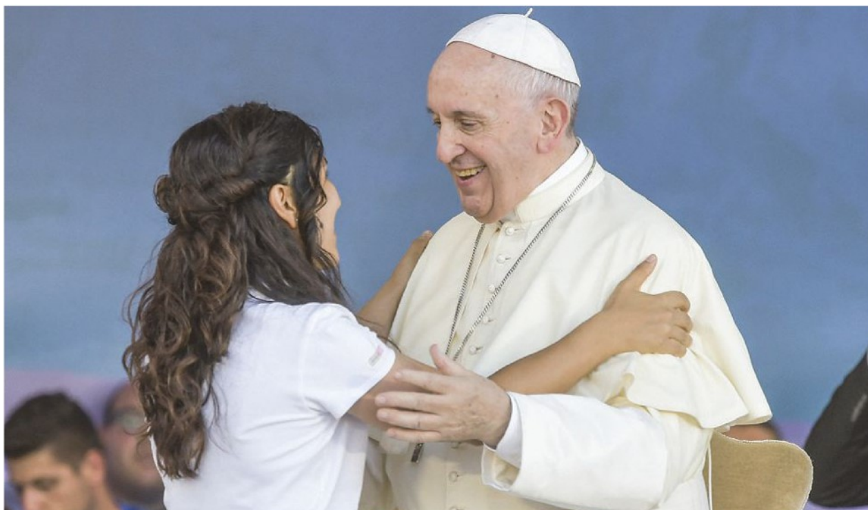
Papa Francesco durante l'incontro con i giovani italiani al Circo Massimo «Per mille strade» il 10 agosto 2018

2994 - ARTICOLO NON CEDIBILE AD ALTRI AD USO ESCLUSIVO DEL CLIENTE CHE LO RICEVE