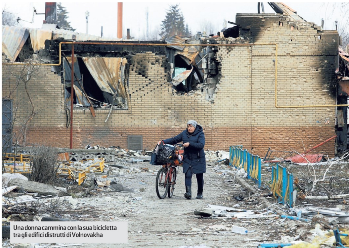
Una donna cammina con la sua bicicletta tra gli edifici distrutti di Volnovakha

La Contesa è causa della corruzione non meno che della realtà delle cose