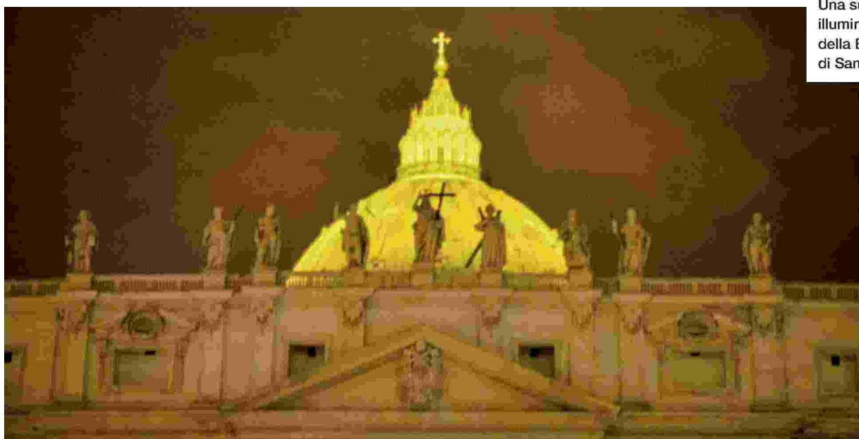
Una suggestiva illuminazione della Basilica di San Pietro

14 Benedetto XVI, Lett. enc. Deus caritas est (25 dicembre 2005), n. 1: AAS 98 (2006), 217; cf. Francesco, Esort. apost. Evangelii gaudium , n. 3: AAS 105 (2013), 1020.