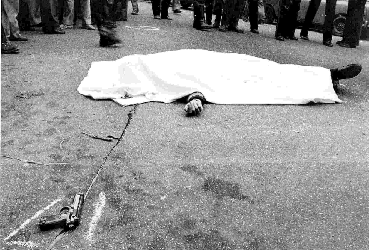
Uno degli agenti della scorta di Aldo Moro, trucidato in via Fani il 16 marzo 1978 dalle Br