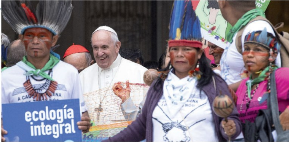
Il Papa con rappresentanti indigeni al Sinodo per l'Amazzonia dell'ottobre 2019