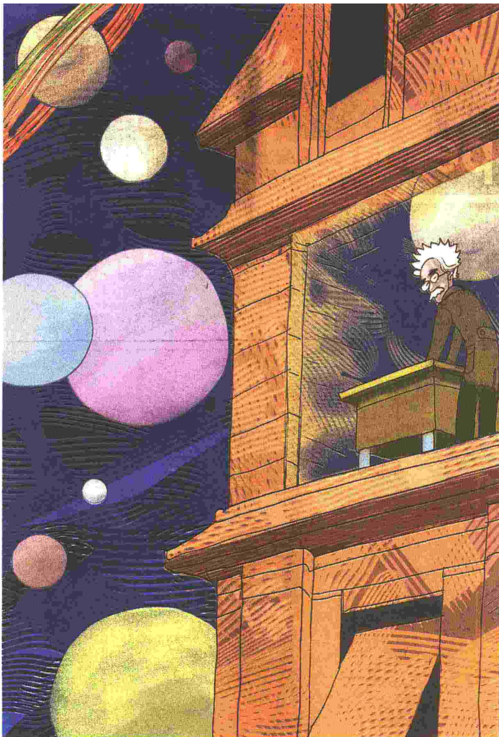
ILLUSTRAZIONE DI GIANCARLO CALIGARIS

” Senza crisi non ci sono sfide, senza sfide la vita è una routine, una lenta agonia. Nella crisi emerge il meglio di ognuno