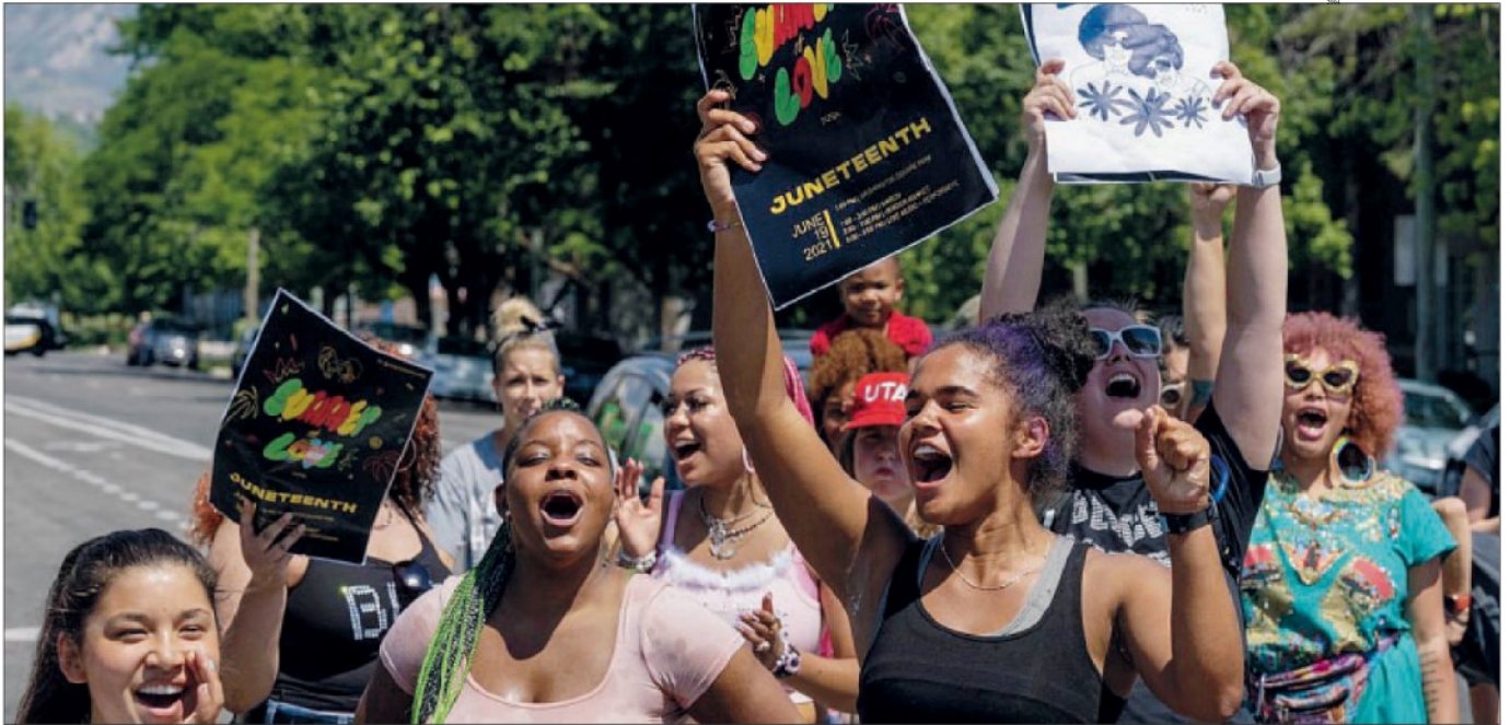
Black Lives Matter a Salt Lake City per la celebrazione del Juneteenth, l'abolizione della schiavitù