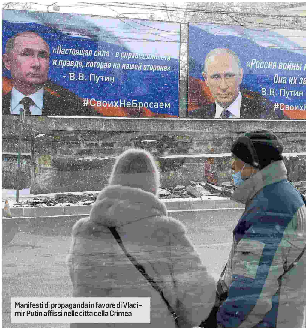
Manifesti di propaganda in favore di Vladimir Putin affissi nelle città della Crimea

Quando sei un leader e commetti così tanti errori, devi accettare di ritirarti